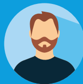
Un ex-acheteur Spécialiste de la négociation